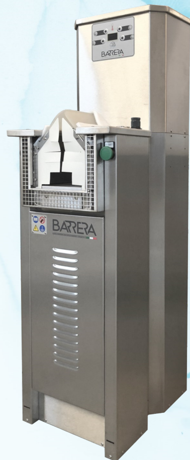
Dimensioni / Dimensions : cm. 37 x 50 x H. 135

This Conditioner is for steaming and activating of the full upper without getting the leather wet as other conditioners do. It fully activates the toe puff and counter allowing for a perfect lasting operation. It is very suitable for cowboy boots and heavy work boots because the steam penetrates through the leg of the boot which helps in the lasting process. The machine has independent controls and displays for the monitoring of the amount of steam, steam temperature and steam generation.