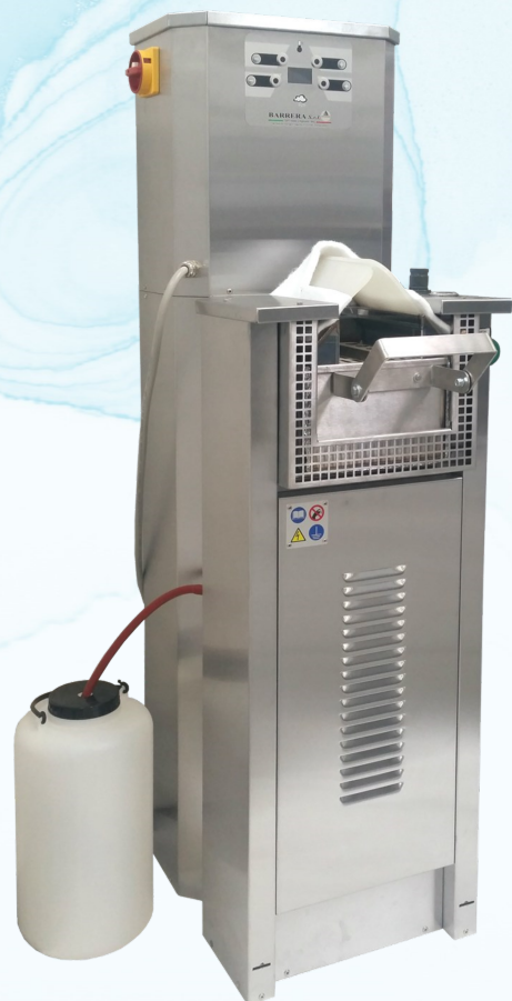
Dimensioni / Dimensions : cm. 37 x 50 x H. 135

This conditioner is the perfect machine to reactivate and put steam through the complete seat and side of a shoe or boot before lasting. It can also be used for the activation of seat and counter before back part moulding. The machine has independent controls and displays for the monitoring of the amount of steam, steam temperature and steam generator.